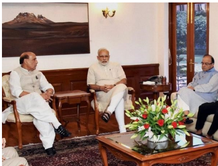
Delhi, 19 sept. : réunion de crise autour du Premier ministre Narendra MODI , ou la recherche d'une réponse appropriée.