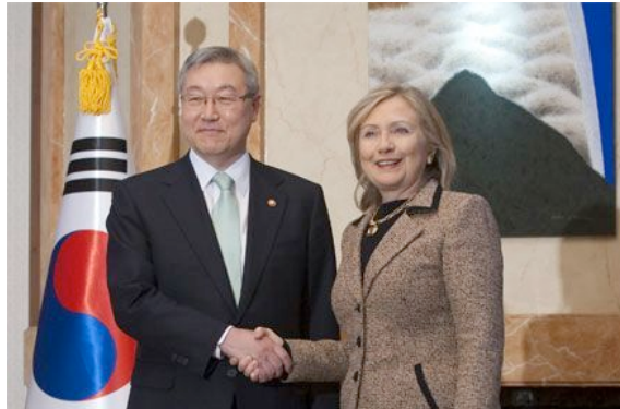
La secrétaire d'État Hillary Clinton, en compagnie du ministre des Affaires étrangères coréen, Kim Sung-Hwan, lors de son séjour à Séoul le samedi 16 avril

Alors que l'Administration Obama estime être finalement prête à déposer l'Accord de libre-échange (ALE) entre les États-Unis et la Corée du Sud devant le Congrès, certains représentants républicains ont opposé des points d'ordre dans le but d'en retarder l'adoption. Le sénateur Ohrin Hatch (R-UT), membre de la commission sénatoriale des Finances, ainsi que le représentant Dave Camp (R-MI), président de la commission sur les Voies et Moyens, ont demandé un avis juridique afin d'obtenir l'assurance que les modifications apportées au texte de l'ALE en décembre 2010 sont conformes à la procédure du « fast track ». 1 Ils exigent aussi que l'Administration Obama notifie officiellement son intention de déposer le texte de l'ALE avec la Colombie. Ces réticences de la part des républicains surviennent à un moment où le Congrès est paralysé par un nouveau débat sur le budget, concernant cette fois la limite légale de la dette fédérale américaine. Ce débat pourrait durer jusqu'en juin, ce qui laisse présager que les questions de politique commerciale pourraient elles aussi être paralysées au moins jusqu'à cette date.