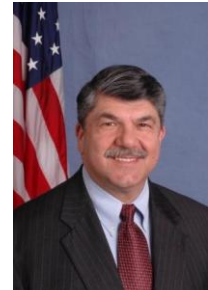
Président de l'AFL-CIO Richard Trumka

La plus importante centrale syndicale américaine, la American Federation of Labor and Congress of Industrial Organizations (AFL-CIO) et ses syndicats affiliés, se sont prononcés jeudi le 9 décembre dernier contre l'adoption de l'Accord de libre-échange (ALE) entre les États-Unis et la Corée du Sud. Cette prise de position marque une brèche dans le front syndical américain, alors qu'un des plus importants syndicats américains, la United Auto Workers (UAW) qui regroupe les employés des trois grands constructeurs automobiles américains, s'est déjà prononcée en faveur de l'ALE. La United Food and Commercial Workers International (UFCW), qui représente 1,3 million de travailleurs de l'industrie de la transformation agroalimentaire s'est aussi prononcée en faveur de l'ALE. Historiquement, l'AFL-CIO et l'UAW ont fait front commun sur l'enjeu du commerce international.