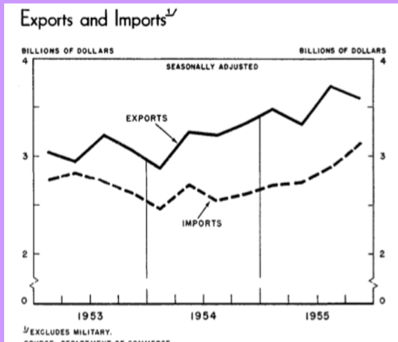
Balance commerciale américaine de 1953 à 1955