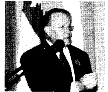
Monsieur Bernard Landry au colloque sur le Bien Commun