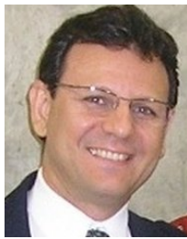
Table-Ronde sur l'économie politique / Roundtable on Political Economy: “The Americas – Looking inward, north, east or west?”