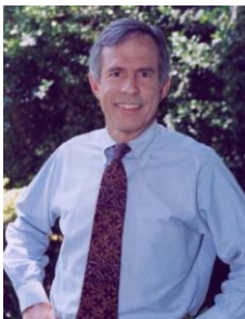
Le représentant Bart Gordon (D-TN)

La soudaine contraction du commerce des terres rares sur le marché international attise les tendances protectionnistes des pays développés, où les industries de pointe ont un besoin essentiel de ces matières premières. Le 28 septembre dernier, la Chambre des représentants a voté le projet de loi H.R. 6160, le Rare Earths and Critical Materials Revitalization Act of 2010 , qui propose de financer la recherche et de fournir les garanties de prêts nécessaires à l'industrie extractive américaine pour qu'elle reprenne l'exploitation des mines abandonnées aux États-Unis au cours des années 1990 et 2000. Les entreprises qui exploitaient ces sites étaient incapables de concurrencer avec les entreprises chinoises, qui jouissent du soutien de l'État et de l'absence de normes environnementales et de normes du travail décentes pour diminuer leurs coûts. Le projet de loi prévoit aussi la