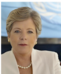
Alicia Bárcena, secrétaire exécutive de la CEPALC

Dans le cadre de la visite officielle du président Obama en Amérique latine du 19 au 23 mars, la Commission économique pour l'Amérique latine et les Caraïbes (CEPALC) a publié un rapport brochant un portrait détaillé des relations économiques et commerciales entre l'Amérique latine et les États-Unis. On y constate que l'absence d'une politique commerciale régionale cohérente de la part des États-Unis depuis l'abandon de la Zone de libre-échange des Amériques (ZLEA) y limite la croissance du commerce. Pourtant, le potentiel de croissance y est justement important, alors que l'Amérique latine se remet rapidement de la crise économique de 2008 et semble enfin avoir acquis une certaine stabilité macroéconomique après les dures réformes qui ont caractérisé la décennie 1995-2005. Les États-Unis restent le principal partenaire commercial de la région, mais à défaut d'y établir une stratégie cohérente d'intégration régionale, les auteurs du rapport prévoient un déclin relatif continu de la part de la première économie mondiale dans les économies latino-américaines.