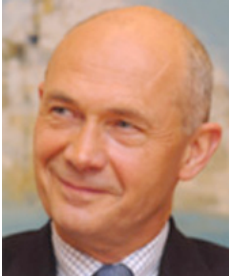
Directeur général de l'OMC, Pascal Lamy

Fin de la récession mondiale : L'OMC prévoit une forte croissance des échanges en 2010