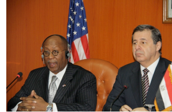
Le Représentant pour le commerce, Ron Kirk, et le ministre égyptien du commerce, Rachid Mohamed Rachid

Lors des réunions de cette semaine, Kirk et son homologue égyptien, le ministre du Commerce Rachid Mohamed Rachid, ont convenu de doubler le volume des exportations entre les deux pays au cours des cinq prochaines années et d'étudier la possibilité d'inclure de nouvelles catégories de biens exempts de droits de douane produits dans les Zones industrielles qualifiées (ZIQ). L'Égypte compte six de ces zones industrielles dans lesquelles des entreprises exportatrices jouissent d'un libre accès au marché américain moyennant que plus de 10,5 % des matières premières incluses dans la transformation et la production des biens proviennent d'Israël. Pour l'instant, la très large majorité de ces exportations d'une valeur de 800 millions de $ É-U en 2009, près de la moitié des importations américaines depuis l'Égypte, correspondent à des vêtements. Le ministre Rachid a signalé son désir de voir la gamme de produits inclus dans le programme préférentiel s'étendre à des biens environnementaux, des produits des technologies de l'information, de la machinerie et des produits du cuir. Un groupe de travail mis sur pied à l'occasion de la visite de Kirk étudiera ces possibilités.