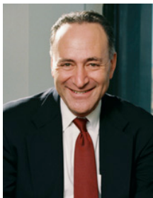
Le Sénateur Charles Schumer (D-NY)